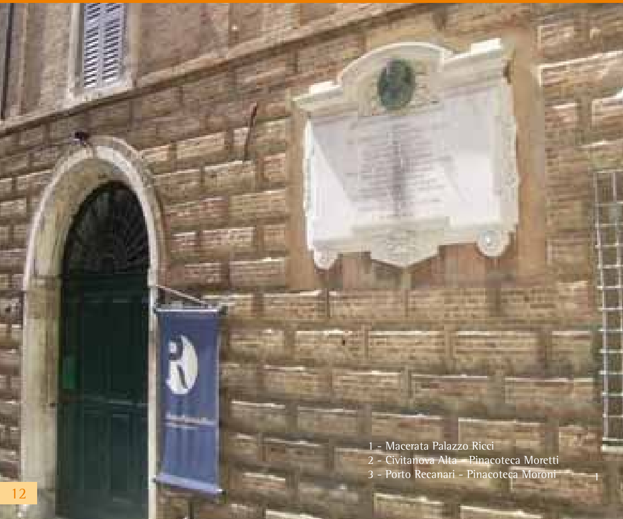
1 - Macerata Palazzo Ricci 2 - Civitanova Alta - Pinacoteca Moretti 3 - Porto Recanati - Pinacoteca Moroni

Questo itinerario accompagna gli studenti a scoprire opere importanti dell'arte contemporanea esposte in allestimenti particolari: non musei veri e propri, ma edifici storici di pregio che rendono le collezioni particolarmente accattivanti. Tra tanti nomi famosi sarà possibile anche scoprire artisti locali che in qualche maniera hanno aderito a correnti artistiche nazionali ed internazionali. In alcuni centri storici sarà inoltre possibile scoprire edifici che sono espressioni dell'architettura del Novecento.